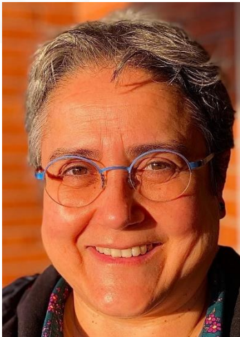
Dra. Pilar Marcos Hospital Germans Trias i Pujol (Badalona)