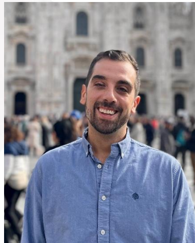
Dr. Eric Mayor Hospital Clínic (Barcelona)